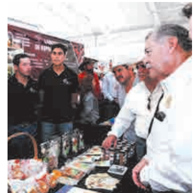
Nuevo León, ganaderos del estado y de otras entidades del país.

Además se contó con la presencia de alcaldes, diputados, funcionarios de la Secretaría de Agricultura y Desarrollo Rural estatal y de la Unión Ganadera Regional de